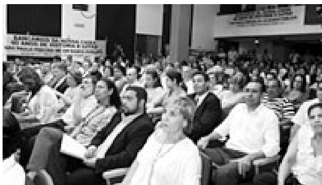
Bancários da Nossa Caixa na Assembléia

A emenda aglutinativa também garante a manuten-