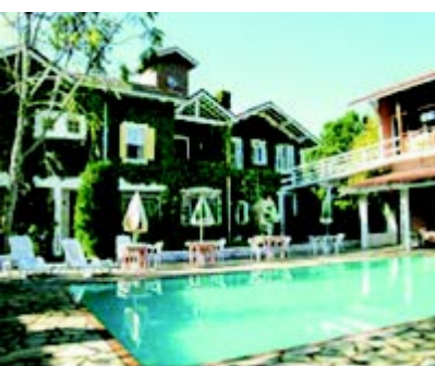
Sto Ant Pinhal SP Pousada