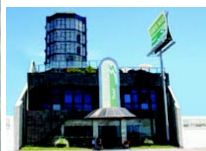
Maceió AL Hotel