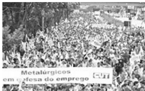
Metalúrgicos do ABC em defesa dos empregos

Corretores: "Banco, no Brasil, é corretor de título público", disse o economis-