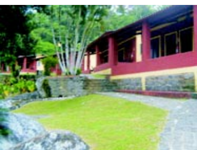
Ubatuba SP Pousada