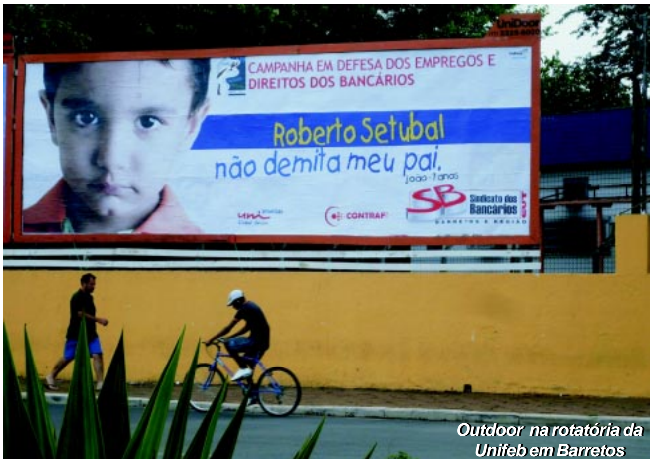
Outdoor na rotatória da Unifeb em Barretos

A campanha foi decidida durante a 4ª Reunião Conjunta das Redes Sindicais de Bancos Internacionais, realizada na sede da Contraf/CUT no final do ano de 2008, e teve início com os bancários do Itaú e Unibanco, mas atingirá os trabalhadores de todos os bancos, que também têm seus postos de trabalho em risco por conta de outras fusões (como nos casos Santander-Real e Banco do Brasil-Nossa Caixa) ou dos possíveis efeitos da crise financeira internacional.