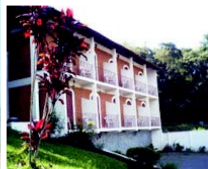
Poços Caldas MG Chalés