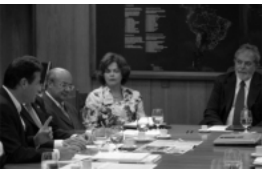
Artur, da CUT, fala com presidente Lula durante reunião com as centrais no dia 19

centrais sindicais, solicitada pela CUT.