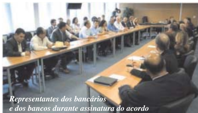
Representantes dos bancários e dos bancos durante assinatura do acordo

fazer denúncias no sindicato. O denunciante deverá se identificar para que a entidade possa dar o devido retorno ao trabalhador. O sigilo será mantido e o sindicato terá prazo de dez dias úteis para apresentar a denúncia ao banco. Após receber a denúncia, o banco terá 60 dias corridos para apurar o caso e prestar esclarecimentos à entidade sindical.