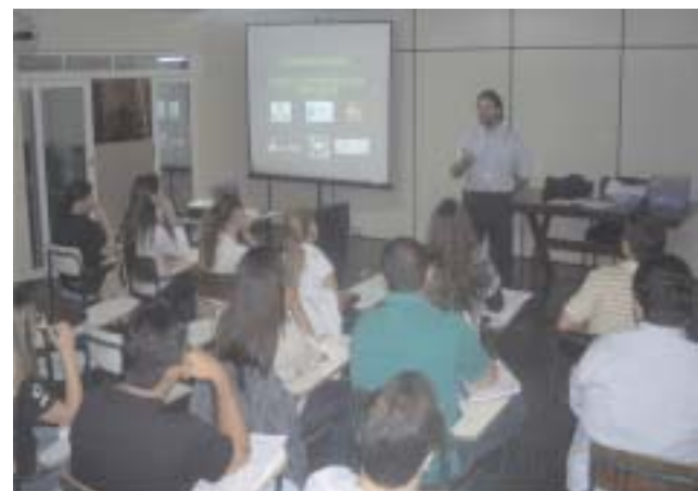
Curso ANBID CPA 10 realizado na sede do Sindicato em Junho de 2010