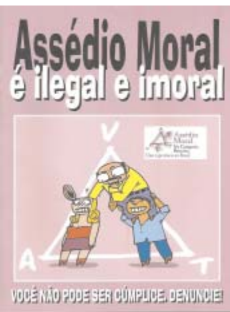
Cartilhas distribuídas aos bancários em 2006