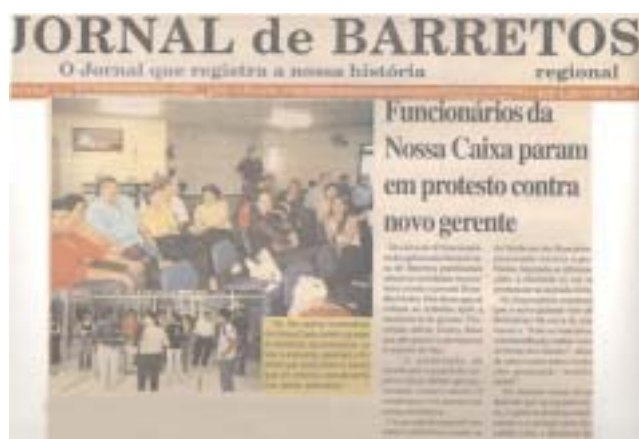
Matérias de capa publicadas: Jornal de Barretos Regional e Jornal O Diário do município de Barretos