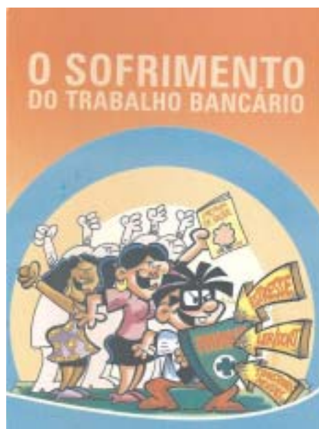
Distribuição de exemplares à categoria em 2009